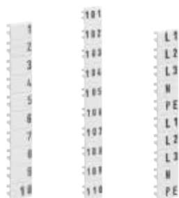
KWL002 KWL003 KWL004